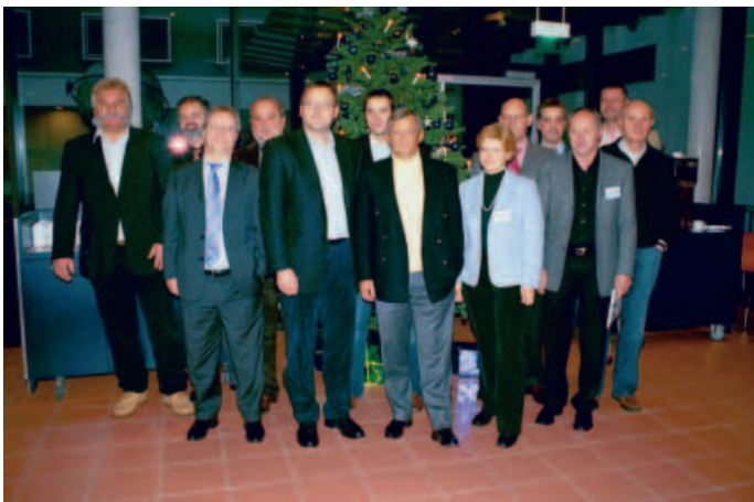
Die Firmenvertreter beim Treffen der »Denkmal« GmbH

Deutscher Naturwerkstein-Verband e.V. Sanderstraße 4 97070 Würzburg Tel.: 09 31 / 1 20 61 Fax: 09 31 / 1 45 49 Internet: www.natursteinverband.de